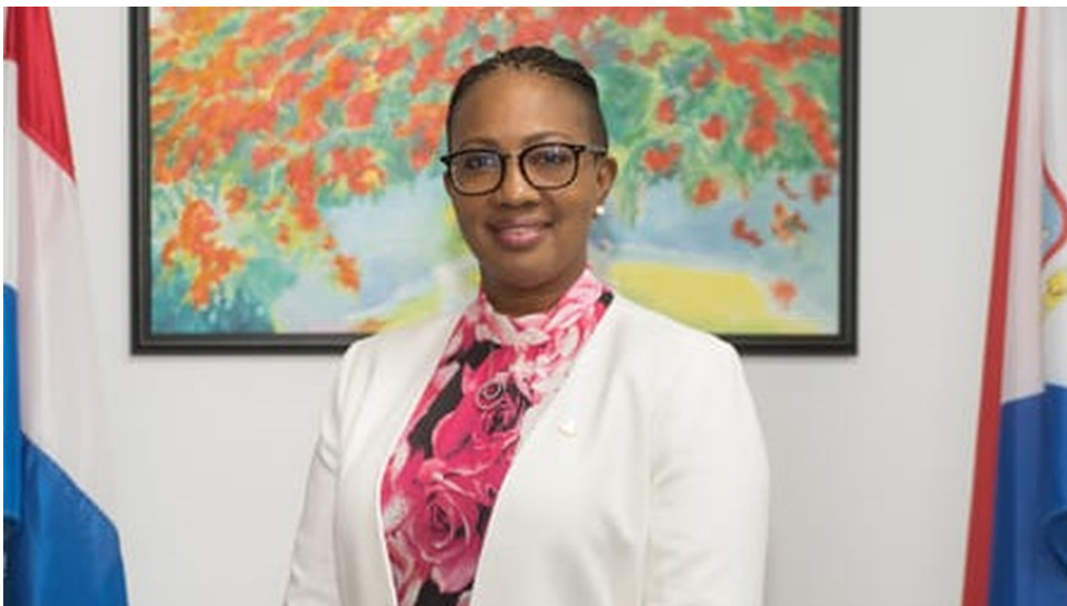
Silveria Elfrieda Jacobs, Prime Minister of Sint Maarten

Silveria Elfrieda Jacobs is sinds 19 november 2019 minister president.