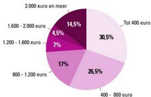
Maandelijks partneralimentatie aan de vrouw in procenten (2009)